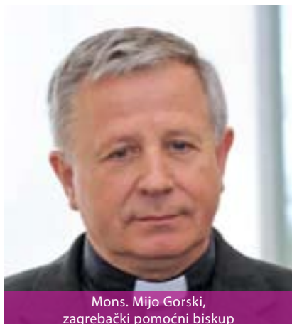
Mons. Mijo Gorski, zagrebački pomoćni biskup

76. je nadbiskup zagrebački. Katedrala na zagrebačkom Kaptolu posvećena je Uznesenju BDM na nebo, a suzaštitnik je sv. Stjepan, kralj. U njoj se nalazi grobnica sa zemnim ostacima hrvatskih velikana: hrvatski mučenici Petar Zrinski i Fran Krsto Frankopan,