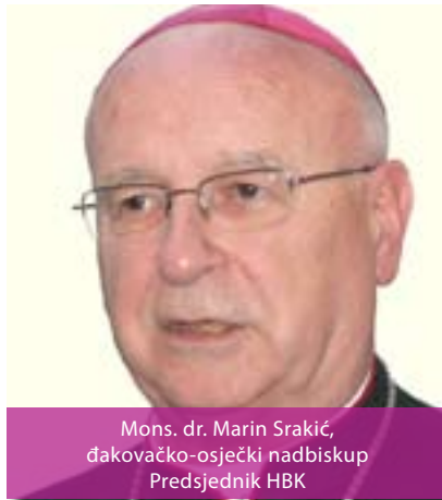
Mons. dr. Marin Srakić, đakovačko-osječki nadbiskup Predsjednik HBK

Đakovačko-osječka nadbiskupija obuhvaća Slavoniju. Širenjem kršćanstva u Panoniji i ovdje je organiziran život Crkve, te je za ovaj kraj osnovana Bosanska biskupija, koja se prvi put spominje 1088. godine, a oko 1250. biskup ima sjedište u Đakovu. Nakon što je srijemski dio oslobođen od Turaka, Crkva se reorganizira i na tom području, te 1773. godine nastaje Bosansko-srijemska biskupija sa sjedištem u Đakovu. Od 1963. godine biskupija je nosila ime Đakovačka i Srijemska, a sufraganska je bila Zagrebačkoj metropoliji. U lipnju 2008. godine papa Benedikt XVI. utemeljio je novu Đakovačko-osječku metropoliju te uzdigao biskupiju Đakovačko-osječku na metropolitansko sjedište i u rang nadbiskupije. Kao sufranske dodijelio joj je Srijemsku i Požešku