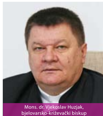
Mons. dr. Vjekoslav Huzjak, bjelovarsko-križevački biskup

Ovo je najmlađa biskupija u Hrvatskoj, utemeljena 5. prosinca 2009. godine. U 56 župa živi oko 185.000 katolika, za koje se brine 55 svećenika. Sjedište biskupije je u Bjelovaru, u kojem je i Katedrala sv. Terezije Avilske, dok je konkatedralno sjedište u Križevcima, a konkatedrala dosadašnja crkva sv. Križa. Zaštitnik biskupije je sv. Marko Križevčanin.