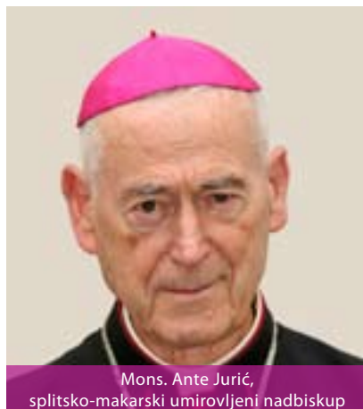
Mons. Ante Jurić, splitsko-makarski umirovljeni nadbiskup

tlu. Nasljednica je starokršćanske Salone (304. godine). Među najznačajnije događaje novije povijesti svakako se ubraja posjet pape Ivana Pavla II. Splitu, 4. listopada 1998., kada je na splitskom Žnjanu predvodio misno slavlje i pohodio Svetište Gospe od otoka u Solinu. Katedralna crkva na-