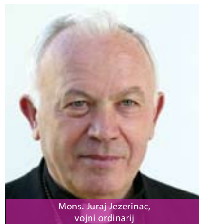
Mons. Juraj Jezerinac, vojni ordinarij

ve, koji stalno obavljaju službu koju im je povjerio Vojni ordinarij ili im je za nju dao svoju suglasnost. Vojna biskupija sastoji se od vojno-redarstvenih kapelanija, u kojima rade svećenici-vojni kapelani, koji imaju prava i dužnosti župnika ili župskih vikara. Od 29 kapelanija, nakon preustroja HV-a, danas ih ima 22. Isto toliko kapelanija je i u policiji. Vojna biskupija ima 30 svećenika. Zaštitnica je BDM – Gospa Velikoga Hrvatskoga Krsnog Zavjeta, a njezin se blagdan slavi 5. kolovoza. Sjedište Vojnog ordinarijata je na zagrebačkom Ksaveru. ●●●