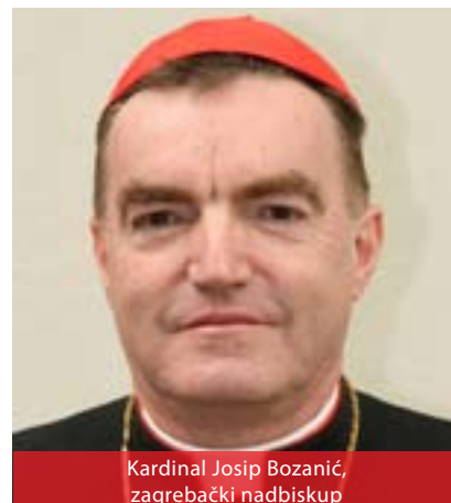
Kardinal Josip Bozanić, zagrebački nadbiskup

U rimsko doba na području današnje Zagrebačke nadbiskupije prostirala se pokrajina Pannonia Savia sa središtem u Sisciji (danas grad Sisak). Na tom se području kršćanstvo počelo širiti već tijekom III. stoljeća. Nakon pada Sirmiuma 441. godine Siscia se pridružila metropoliji u Soloni (Solin). Tijekom seobe naroda (VI./VII. st.) ta se biskupija gasi, a nastojanja da se obnovi na I. splitskom saboru godine 925., za vrijeme kralja Tomislava, nisu uspjela. Mađarski kralj Ladislav, odijelivši na crkvenom polju Posavsku Hrvatsku od metropolije u Splitu i ostalih dijelova Hrvatske, utemeljio je godine 1094. Zagrebačku biskupiju, prvi biskup bio je Duh, a biskupija kao sufraganska podvrgnuta metropoliji u Ostrogonu u Mađarskoj. Godine 1180. Zagrebačka biskupija ušla je u Kaločku metropoliju, u kojoj je ostala sve do 11. prosinca 1852. godine, kad ju je papa Pio IX. uzdigao na razinu nadbiskupije i metropolije. Bilo je to