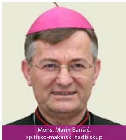
Mons. Marin Barišić, splitsko-makarski nadbiskup

Splitsko - makarska nadbiskupija najstarija je biskupija na hrvatskom