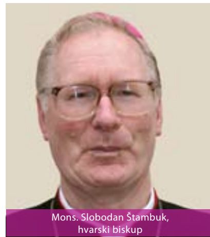
Mons. Slobodan Štambuk, hvarski biskup

Hvarska biskupija utemeljena je 1147. godine. U početku su biskupiji pripadali otoci Mljet i Korčula te Makarsko primorje. Danas su u njezinu sastavu Hvar, Brač, Vis, Šćedro i manji otoci. Sjedište biskupije je u Hvaru, gdje se nalazi katedrala sv. Stjepana, pape i mučenika koja potječe iz XII. stoljeća. On je i zaštitnik grada i biskupije. Biskupija ima 33 svećenika, 46 župa i oko 28.000 vjernika.