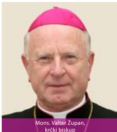
Mons. Valter Župan, krčki biskup

U prvim stoljećima kršćanstva na Jadranu su nastajala biskupska sjedišta. Među njima je i Krčka biskupija sa sjedištem u gradu Krku. Na Kvarneru su postojale i Osorska i Rapska biskupija, koje su 1828. godine ukinute i pripojene Krčkoj biskupiji. Tijekom povijesti na teritoriju biskupije više puta događala se reorganizacija zbog promjena državno-političkih odnosa. Od 1933. Krčka biskupija bila je izravno podređena Svetoj Stolici. Osnivanjem Riječke metropolije 1969. go-