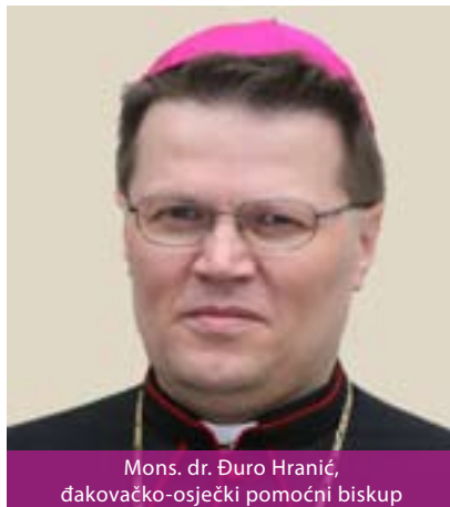
Mons. dr. Đuro Hranić, đakovačko-osječki pomoćni biskup

biskupiju. Đakovačko-osječka nadbiskupija ima oko 450.000 vjernika, 244 svećenika i 152 župe. Katedralna crkva posvećena sv. Petru nalazi se u Đakovu, a zaštitnik nadbiskupije je sv. Ilija, prorok.