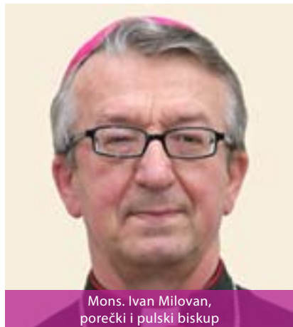
Mons. Ivan Milovan, porečki i pulski biskup

Poreč, koja je danas ujedinjena s biskupijom Pule. Porečka i Pulska biskupija ima 134 župe, 87 biskupijskih svećenika u biskupiji i 12 koji djeluju izvan biskupije.