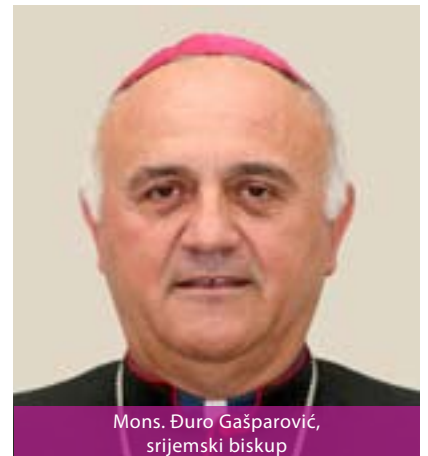
Mons. Đuro Gašparović, srijemski biskup

Srijemska biskupija sufraganska je Đakovačko-osječkoj metropoliji, a nalazi se na području Vojvodine i Srbije. Srijemsku biskupiju, koja je postojala u prva kršćanska vremena, poharali su Huni i Avari. Ugašena je 885. godine smrću biskupa sv. Metoda. Ponovno je osnovana 1231., a 1773. ujedinjena s Đakovačkom biskupijom. Ponovno je 2008. godine osamostaljena odlukom pape Benedikta XVI.. Prema papinoj odluci, srijemski biskup nije član Hrvatske biskupske konferencije, već Međunarodne biskupske konferencije sv. Ćirila i Metoda sa sjedištem u Beogradu. Srijemska biskupija ima 29 župa i 19 svećenika. Katedrala se nalazi u Srijemskoj Mitrovici, a posvećena je sv. Dimitriju.