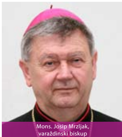
Mons. Josip Mrzljak, varaždinski biskup

Varaždinsku biskupiju papa Ivan Pavao II. utemeljio je 5. srpnja 1997. godine, a prvim biskupom imenovao je mons. Marka Culeja. Sjedište biskupije je u Varaždinu, gdje se nalazi i katedrala posvećena Uznesenju BDM na nebo. Zaštitnik biskupije je sv. Marko Križevčanin, koji se slavi 7. rujna, a suzaštitnik bl. Alojzije Stepinac, čiji je blagdan 10. veljače. Biskupija ima 104 župe, oko 130 dijecezanskih svećenika, na njezinu području djeluje i 25 redovničkih svećenika, nekoliko braće redovnika i oko 130 redovnica.