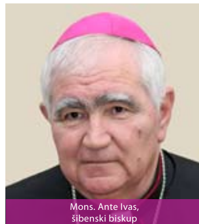
Mons. Ante Ivas, šibenski biskup

Šibenska biskupija ustanovljena je 1298. godine, a prvi biskup bio je fra Martin Rabljanin, gvardijan samostana sv. Frane. Godine 1828. u biskupiju je uključen i teritorij tada ukinute Skradinske i dio Trogirske biskupije. Katedralna crkva posvećena je sv. Jakovu, a zaštitnik biskupije i grada je sv. Mihovil. Prije Domovinskog rata, za vrijeme kojega je doživjela razaranja, progon stanovnika (oko 25.000) i pogibiju, imala je oko 120.000 katolika. Šibenska biskupija danas je organizirana u 74 župe, u kojima djeluju i redovnici i biskupijski svećenici. Šibenska biskupija ima 40 dijecezanskih svećenika i 50-ak redovnika.