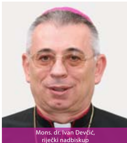
Mons. dr. Ivan Devčić, riječki nadbiskup

2000. odlukom pape Ivana Pavla II., diobom tadašnje Riječko-senjske nadbiskupije na Riječku nadbiskupiju i Gospičko-senjsku biskupiju. Sjedište nadbiskupije je u Rijeci, gdje je i katedrala sv. Vida, zaštitnika nadbiskupije. Blagdan sv. Vida slavi se 15. lipnja. Na području nadbiskupije živi oko 214.000 katolika. Nadbiskupija je podijeljena u 90 župa. U njima djeluje oko 120 svećenika, 76 dijecezanskih i 44 redovnička.