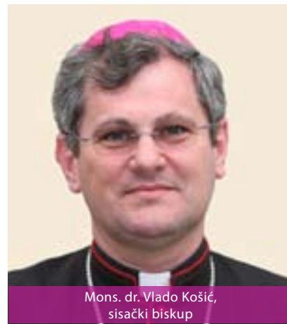
Mons. dr. Vlado Košić, sisački biskup

Papa Benedikt XVI. 5. prosinca 2009. godine ponovno je uspostavio Sisačku biskupiju. Sisačkim biskupom imenovan je mons. Vlado Košić, ranije zagrebački pomoćni biskup. Sv. Kvirin zaštitnik je Biskupije i grada Siska. Katedrala je posvećena Uzvišenju Svetog Križa. Sisačka biskupija ima 58 župa, 55 svećenika – dijecezanskih i redovničkih. Broji oko 180 tisuća vjernika.