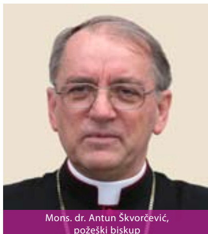
Mons. dr. Antun Škvorčević, požeški biskup

Požeška biskupija osnovana je 5. srpnja 1997. godine na teritoriju koji je do tada pripadao Zagrebačkoj nadbiskupiji. Prostire se na području Za-