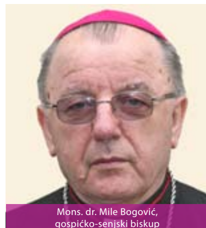
Mons. dr. Mile Bogović, gospičko-senjski biskup

Papa Ivan Pavao II. utemeljio je ovu biskupiju 25. svibnja 2000. godine. Njezino područje danas pripada u najslabije naseljene dijelove naše zemlje. Nekoć su na ovom prostoru bila četiri biskupska sjedišta: Senj, Krbava, Modruš i Otočac, kao i brojni samostani. Katedralna crkva nalazi se u Gospiću i posvećena je Navještenju BDM. Biskupija je podijeljena u 85 župa, pripada joj 37 svećenika i ima oko 75.000 katolika.