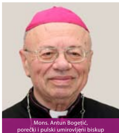
Mons. Antun Bogetić, porečki i pulski umirovljeni biskup